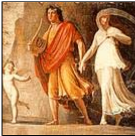
Orfeo y Eurídice.