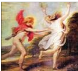
Apolo y Dafne.