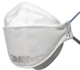
Mascarilla filtrante de protección (EPI) (en este ejemplo es de tipo FFP2 y sin válvula)