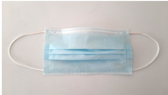
Mascarillas quirúrgicas (no son EPI, sino productos sanitarios)

Directiva 93/42/CEE. Este procedimiento establece que el fabricante, bajo su responsabilidad hará la Declaración de conformidad y colocará el marcado CE en el producto. Se clasifican, según la norma europea en dos tipos de acuerdo con su eficacia de filtración bacteriana (tipo I \leq 95% y tipo II \leq 98%). El tipo II se subdivide a su vez dependiendo de si la mascarilla es resistente o no a las salpicaduras (la "R" significa resistente a las salpicaduras R: \leq 120 mm. de Hg). Este tipo de mascarillas son desechables y no deben ser reutilizadas.