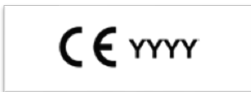
EPI de categoría III