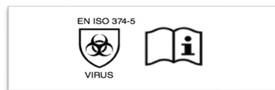
Marcado específico frente a microorganismos. Bacterias, hongos y virus

Fuente NTP 1.143 del Instituto Nacional de Seguridad y Salud en el Trabajo