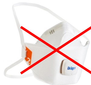
Mascarilla filtrante de protección (EPI) (en este ejemplo es de tipo FFP2 y con válvula)