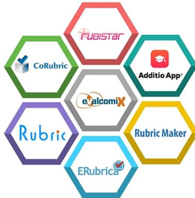
Herramientas TIC para crear rúbricas

Descripción de las herramientas que pueden utilizarse para elaborar rúbricas. (Haciendo clic sobre la imagen accederás a la herramienta)